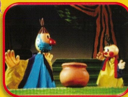
ヤン助とヤン助とヤン助と

【日時】 2025年2月16日(日) 14時～15時20分(休憩15分) 開場13時15分～